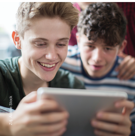
Zd. i. J. S. Stock

Niektóre materiały produkowane przez osoby małoletnie, powstają prawdopodobnie w wyniku nieodpowiedzialnej zabawy i wygłupów , które z pozoru wydają się nieszkodliwe, a tak naprawdę są bardzo niebezpieczne i mogą przynieść poważne konsekwencje. W sieci często publikowane są materiały, na których dzieci lub nastolatki w chaotyczny sposób rozbierają się, przyjmują erotyczne pozy, naśladują ruchy charakterystyczne dla różnych czynności seksualnych. Mimo, że osoby występujące na nich nie chciały zrobić nic złego, ich zabawy mogą przyczynić się do powstawania treści nielegalnych, z których prawdopodobnie będą korzystać osoby o skłonnościach pedofilskich. Niepokojące jest to, że duża liczba takich materiałów, udostępniana jest na portalach skierowanych do osób dorosłych, a większość użytkowników nie podejmuje żadnej reakcji. Co gorsza, w wielu przypadkach internauci je komentują, zachęcając do coraz odważniejszych aktywności. Niestety, zdarza się, że pod wpływem nacisku ze strony społeczności danego portalu, młodzi ludzie decydują się na pokazanie swoich intymnych części ciała, a w niektórych przypadkach na podjęcie różnych czynności seksualnych. Jeżeli kiedykolwiek natrafisz w sieci na treści pornograficzne z udziałem osoby małoletniej, zgłoś je do administratora serwisu lub zespołu Dyżurnet.pl.